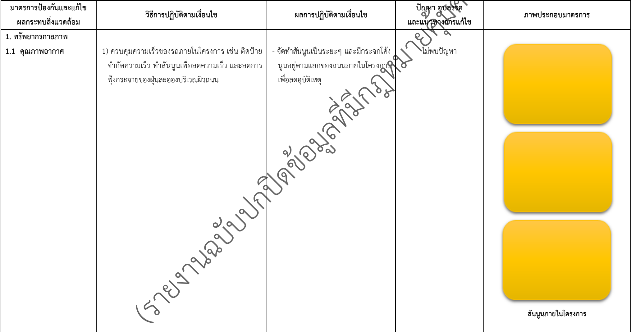
ตารางที่ 2-1 ผลการปฏิบัติตามมาตรการป้องกันและแก้ไขผลกระทบสิ่งแวดล้อมและมาตรการตรวจสอบผลกระทบสิ่งแวดล้อม โครงการจัดสรรที่ดินนันทนาการเดิน พาร์คเพลส แอนด์ เพอร์เฟค ปาล์ม สปริงค์ 345 (ส่วนขยาย)