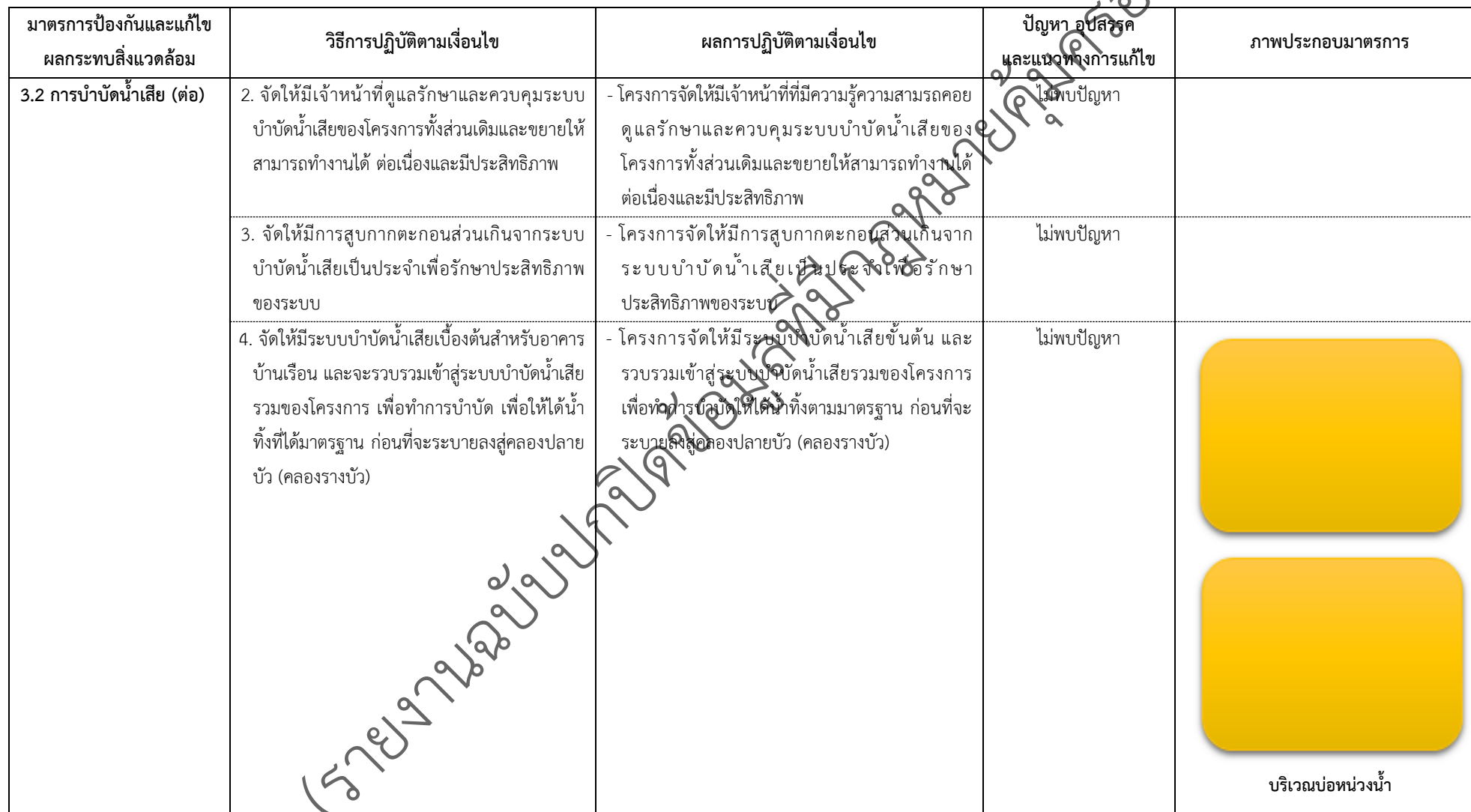
ตารางที่ 2-1 ผลการปฏิบัติตามมาตรการป้องกันและแก้ไขผลกระทบสิ่งแวดล้อมและมาตรการตรวจสอบผลกระทบสิ่งแวดล้อม โครงการจัดสรรที่ดินนันทนาการเดิน พาร์คเพลส แอนด์ เพอร์เฟค ปาล์ม สปริงค์ 345 (ต่อ)